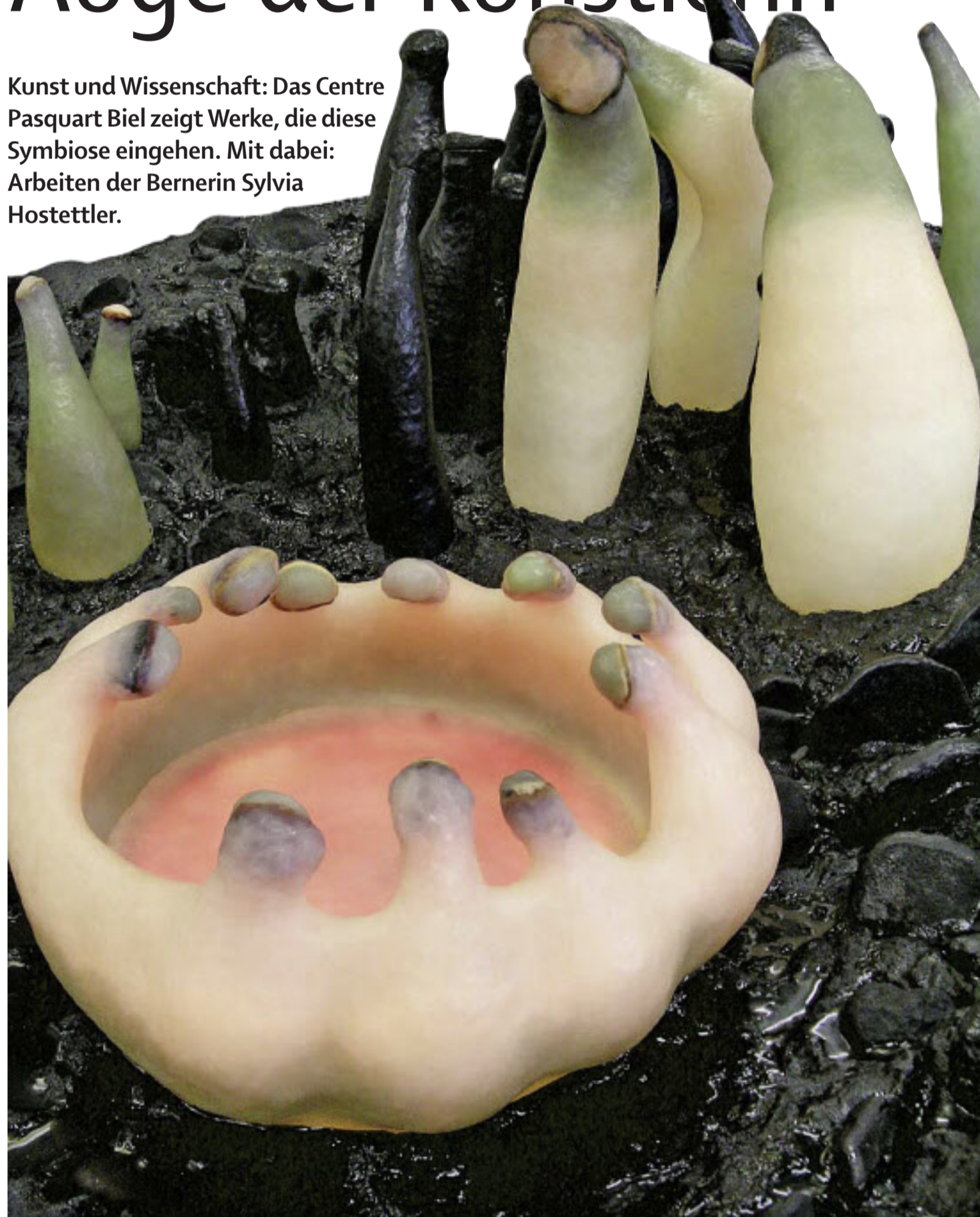
Exotische Welten: Teils Pilz, teils Wachs verweisen die künstlerischen Objekte auf scheinbar unsichtbare Formenwelten in der Natur.